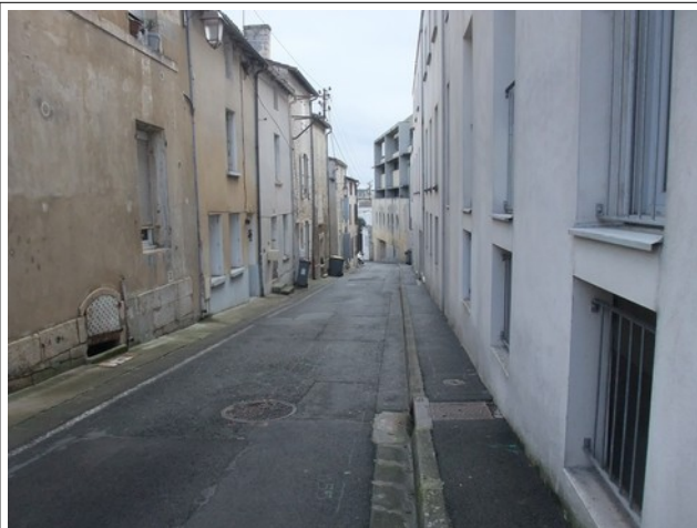
Rue de la Boule d'Or