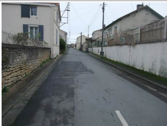
Rue de la Blauderie