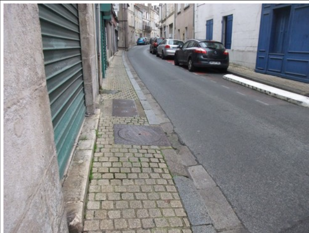
Rue St Gelais