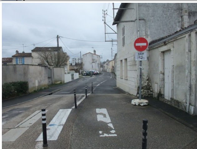
Rue de Bessac