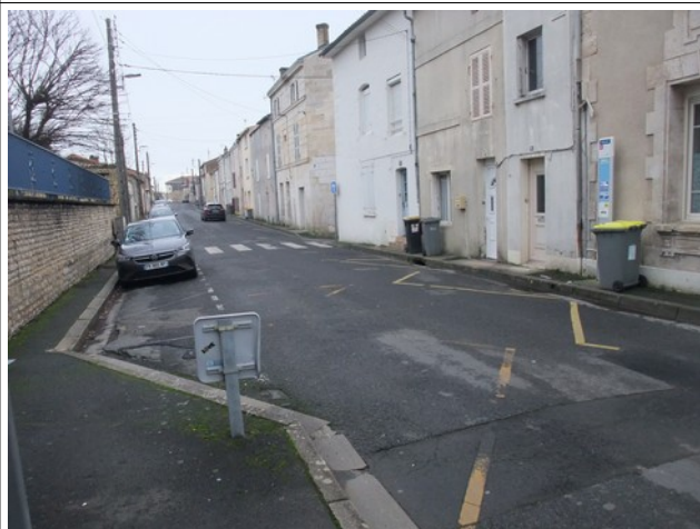
Rue de la Burgonce